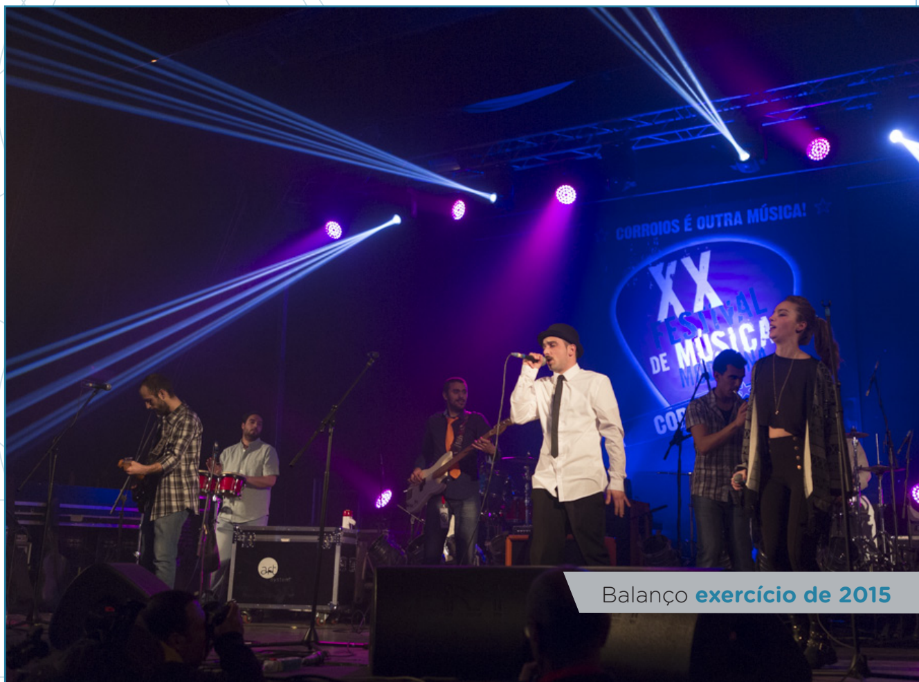
Balanço exercício de 2015